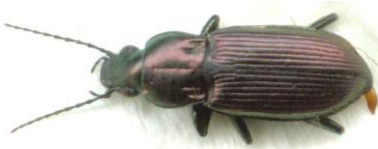
Poecilus lepidus (10-14 mm)