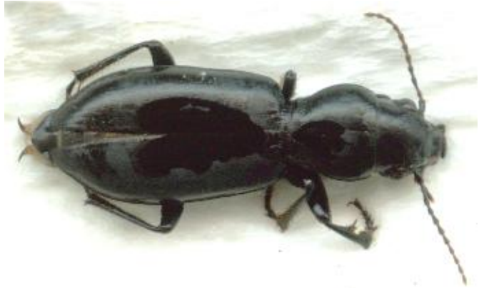
Broscus cephalotes (17-22 mm)