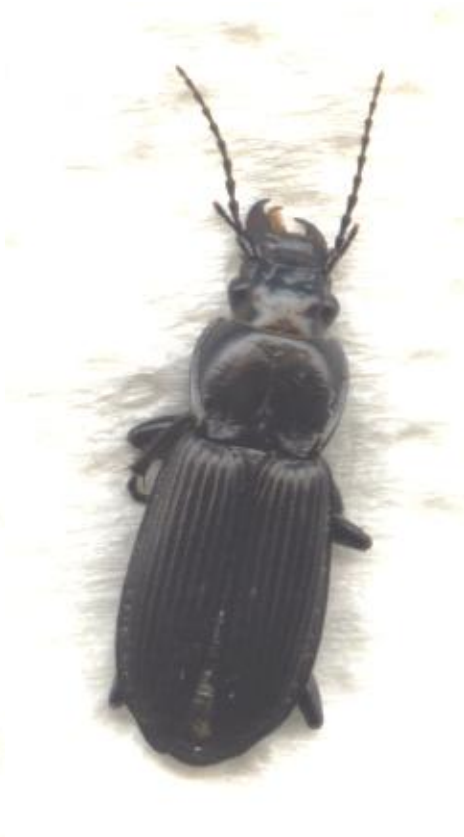
Pterostichus niger (15-21 mm)