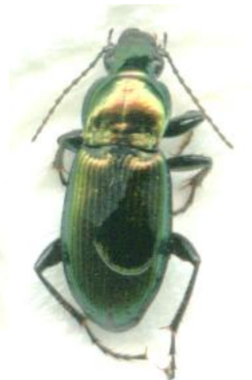
Poecilus versicolor (8-11,5 mm)