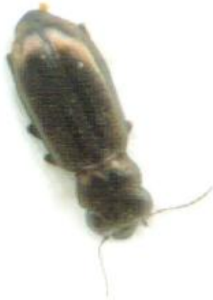
Notiophilus aquaticus (4-5,5 mm)