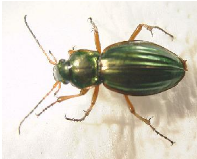
Carabus auratus (17-30 mm)