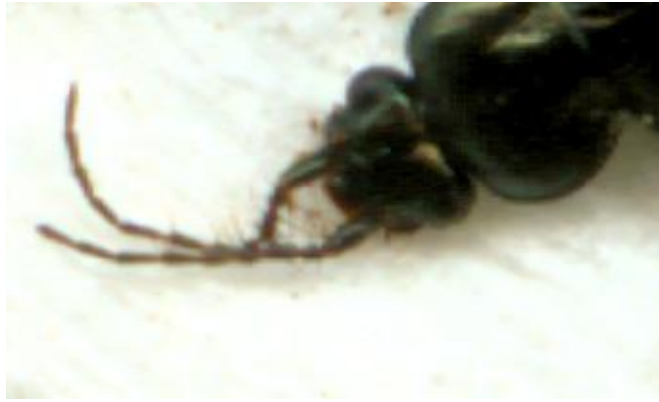
Loricera pilicornis (6-8 mm)