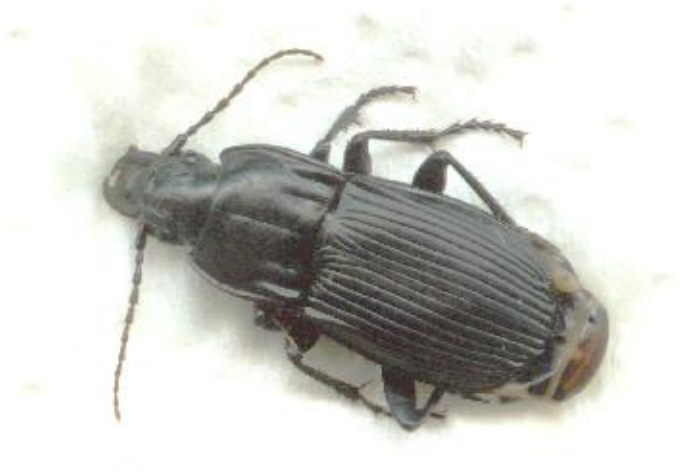
Abax parallelepipedus (16-21 mm)