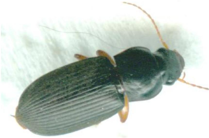
Pseudophonus rufipes (11-16 mm)