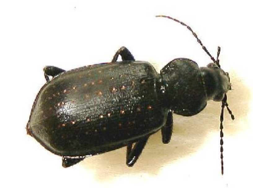
Calosoma maderae (18-30 mm)