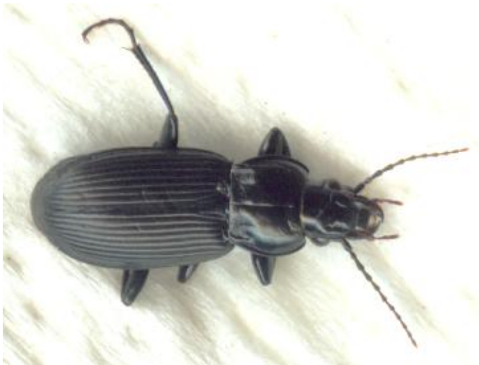
Pterostichus melanarius (13-17 mm)