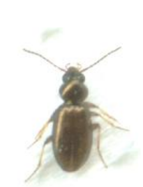
Bembidion lampros (3-4 mm)