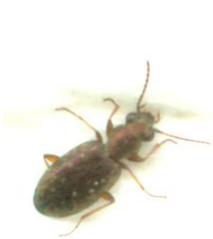
Asaphidion pallipes (4-5,5 mm)